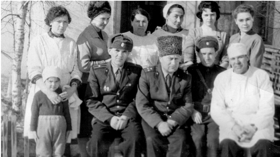
■ Ангарские медики, лечившие строителей АЭХК, около своего общежития в 4 поселке. 1955 год.